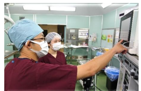
手術室・中央材料室でも先輩が丁寧に指導