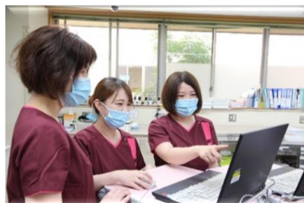
地域包括ケア病棟で手順を学ぶ新人看護師

一人の新人看護師に、一人の先輩看護師(プリセプター)がついて個別指導するほか、看護部全体で育成しています♪