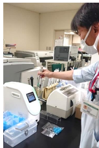
PCR 検査を行う検査技師

COVID-19 の収束が予測できない状況の中で、8月27日、「令和3年度第1回感染制御研修会」を開催し、「コロナ禍における感染症対策について」と題して、ICT 薬剤師・検査技師・看護師が各専門分野における感染症対策について講演しました。今回の研修を通して、全職員が院内感染対策を周知して実践できるように、私たち ICT が中心となって積極的に活動していきたいと考えています。