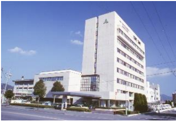
昭和 56 年 4 月 病院新築