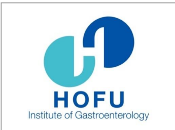
令和 3 年 7 月 ログマーク制定