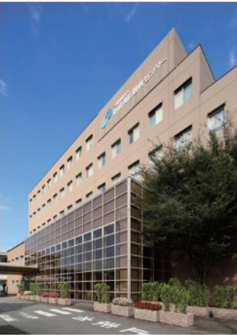
平成 16 年新築 2 期工事竣工