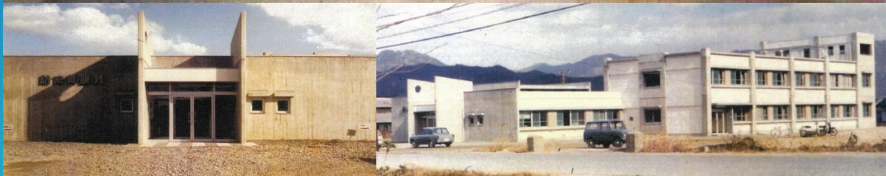
1967年1月、開院当時の防府胃腸科医院